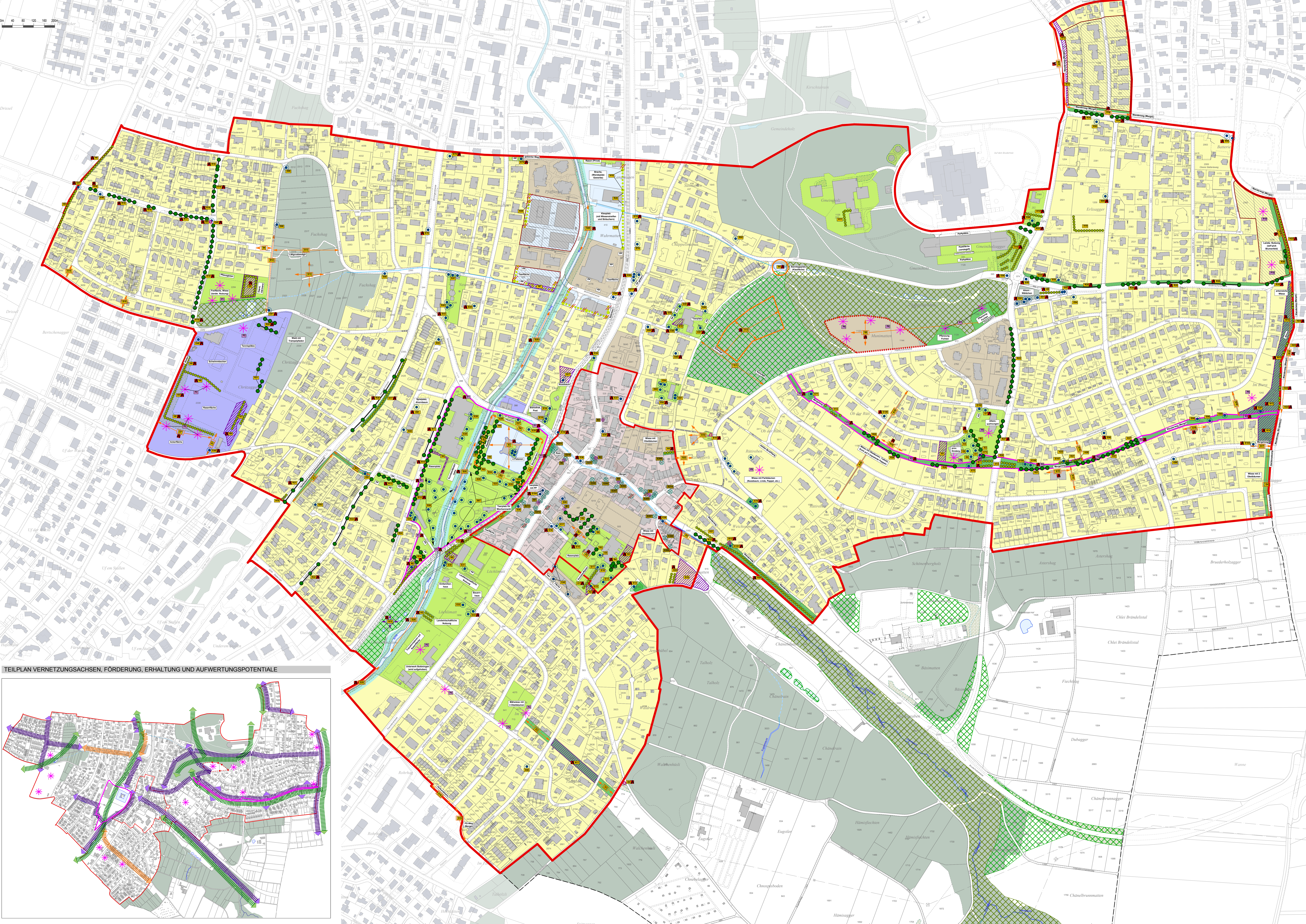
TEILPLAN VERNETZUNGSACHSEN, FÖRDERUNG, ERHALTUNG UND AUFWERTUNGSPOTENTIALE